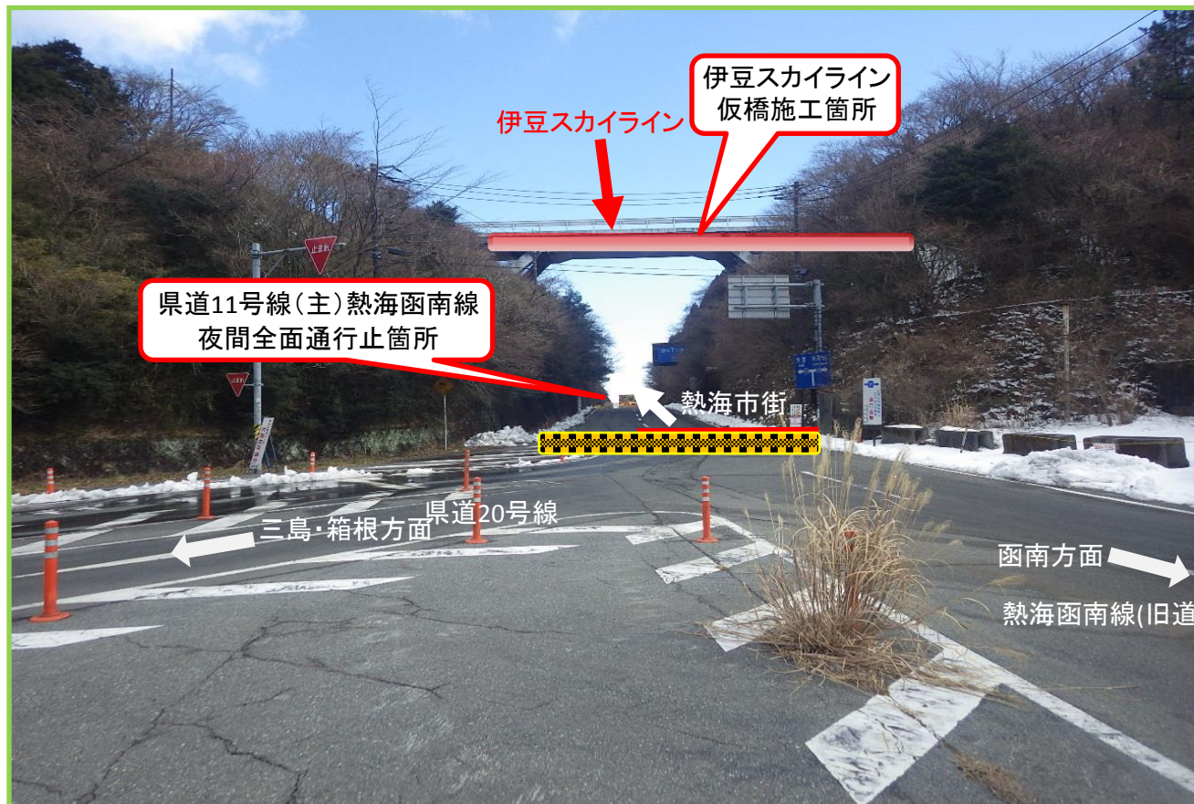
県道11号線(主)熱海函南線の田方郡函南町熱海峠交差点より撮影