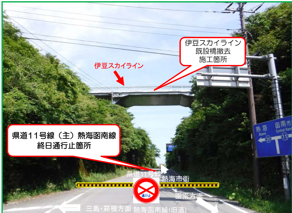
県道11号線(主)熱海函南線の田方郡函南町熱海峠交差点より撮影