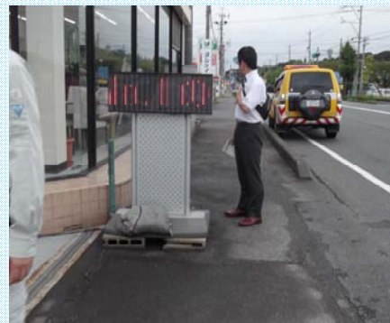
道路パトロールの様子