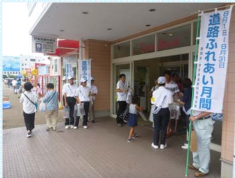
道の駅における街頭キャンペーンの様子

静岡県では、道路局主催のイベントのほか、例年県内7つの土木事務所が地元の道路利用者等の多く集まる道の駅における街頭キャンペーンや、地元住民・団体と協力した道路清掃の実施、道路を広く安全に利用していただくことを目的とした道路パトロールの実施等、様々な活動を展開しています。