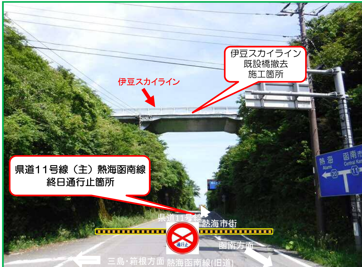
県道11号線(主)熱海函南線の田方郡函南町熱海峠交差点より撮影