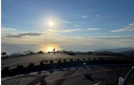
「朝の初島」 鬼頭 順一