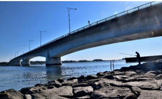
「休日の浜名湖」 小栗 進