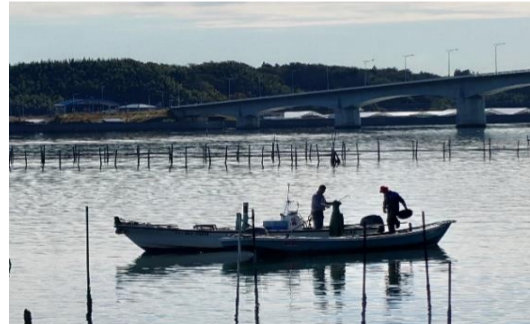
「秋の浜名湖」 牧田 忠明