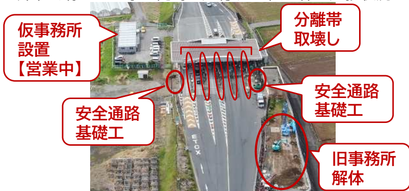
伊豆中央道 江間料金所の様子(R8.4月)

静岡県道路公社では、伊豆中央道・修善寺道路を利用する皆様の利便性向上のため、江間料金所・大仁料金所にETCの導入を進めており、令和8年度末までの運用開始を目指しています。今回は、様々な工事が同時に進行する中、2件の進捗状況をご紹介します。