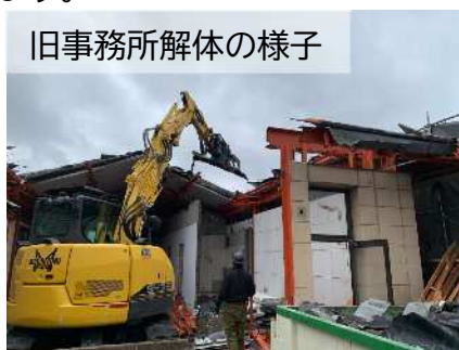
旧事務所解体の様子