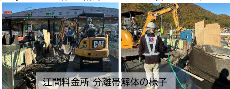
江間料金所 分離帯解体の様子