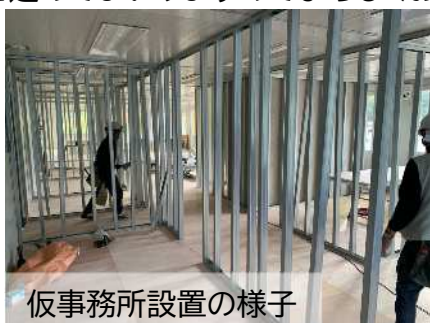
仮事務所設置の様子