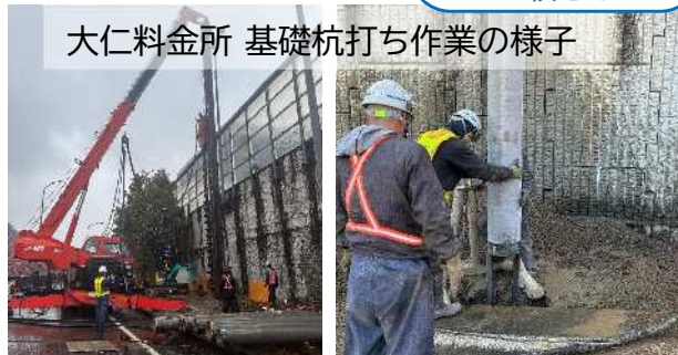
大仁料金所 基礎杭打ち作業の様子