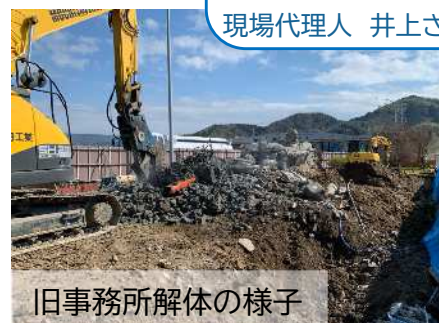
旧事務所解体の様子